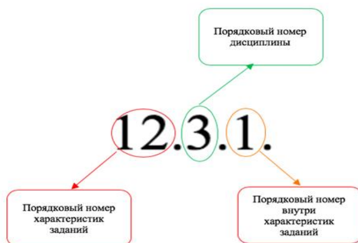
Рисунок 1. Пояснение по трехзначным обозначениям в кодификаторе

Порядковый номер дисциплины отсутствует, если характеристика заданий универсальна для всех дисциплин.