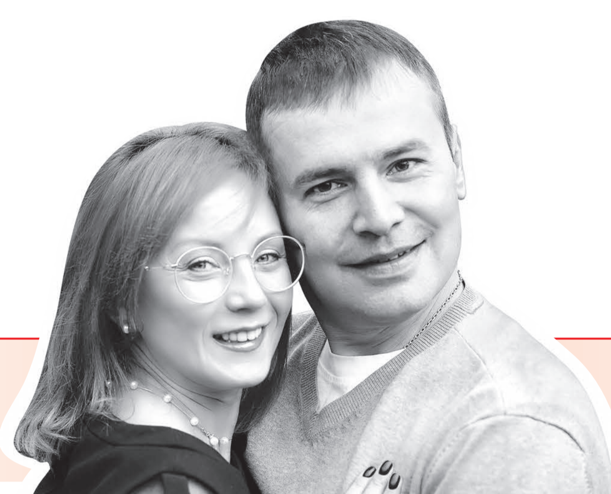
Семья, родители четырех детей